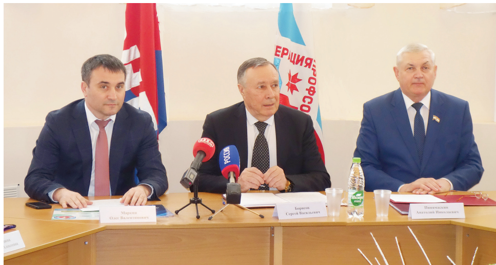
Подписание соглашения о сотрудничестве между Ассоциацией врачей Мордовии и Федерацией профсоюзов РМ.