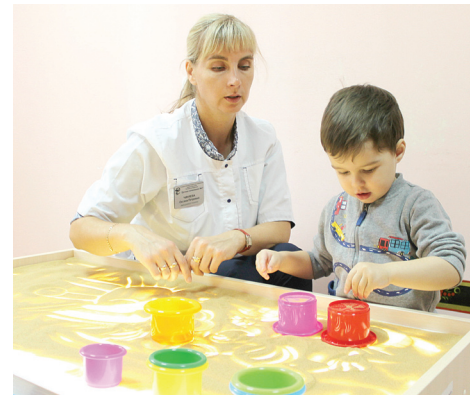
Пескотерапия - увлекательное занятие для медицинской реабилитации детей.

Коллектив Детской поликлиники №2 желает здоровья и счастья своим маленьким пациентам, их родителям и всем врачам Мордовии!