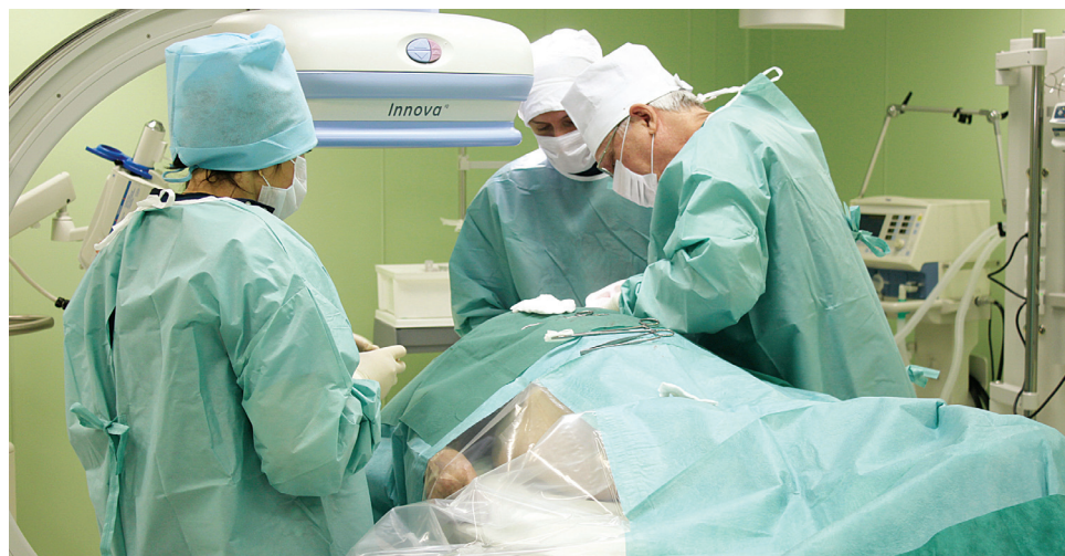
В республиканской центральной клинической больнице проводятся высокотехнологичные операции.

Высокотехнологичная медицинская помощь в МРЦКБ оказывается по 8 профилям: нейрохирургии, травматологии и ортопедии, урологии, оториноларингологии, челюстно-лицевой хирургии, сердечно-сосудистой хирургии, неонатологии, акушерству и гинекологии. За прошедший год в ней было прооперировано около 1000 пациентов.