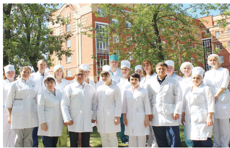
В противотуберкулезном диспансере работают профессионалы.

Ограничения 2021 г. потребовали пересмотра традиционных подходов к оказанию противотуберкулезной помощи населению. Многие фтизиатры были привлечены на работу в Covid-бригады и госпитали. Был разработан алгоритм диагностики туберкулеза органов дыхания в медицинских