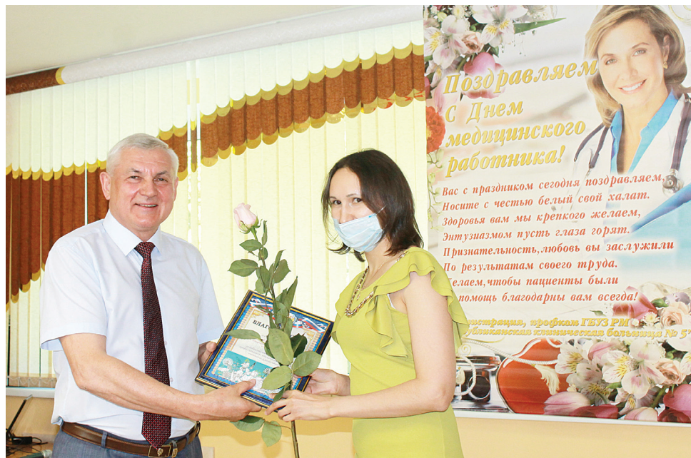
Поздравление и вручение Почётных грамот докторам от Ассоциации врачей Мордовии.

Хочется подчеркнуть, что Ассоциация продолжает активную работу с Национальной Медицинской Палатой по основным вопросам здравоохранения. Каждую среду проходят аппаратные совещания лично с Леонидом Михайловичем Рошалем, на которых обсуждаются актуальные вопросы развития здравоохранения в регионах и в целом в Российской Федерации. Еженедельно Правление Ассоциации участвует в обсуждениях нормативно-правовых актов, регламентирующих систему здравоохранения.