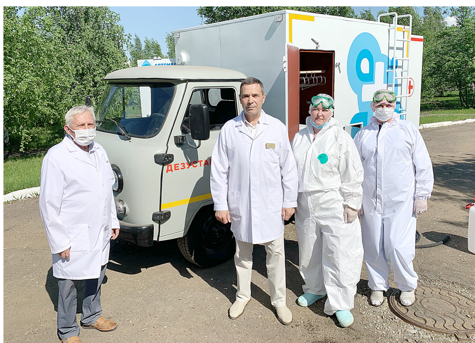
В Республиканской инфекционной клинической больнице есть не только современное стационарное оборудование, но и мобильная дезинфекционная техника.

Важно отметить: РИКБ является клинической базой кафедры инфекционных болезней с курсами эпидемиологии, фтизиатрии, кожных и венерических болезней МГУ имени Н.П. Огарёва. Результат совместной научной работы сотрудников кафедры и врачей больницы - внедрение новых методик в лечение инфекционных заболеваний, публикация научных статей и изданий. Также инфекционная больница принимает участие в проведении клинических исследований новых лекарственных препаратов для лечения больных с инфекционными заболеваниями.