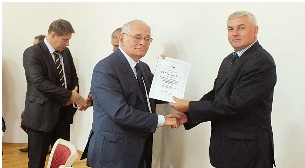
27 сентября 2013 года Ассоциация врачей Мордовии вступила в Национальную медицинскую палату, которую возглавляет врач мирового уровня Л.М. Рошаль.