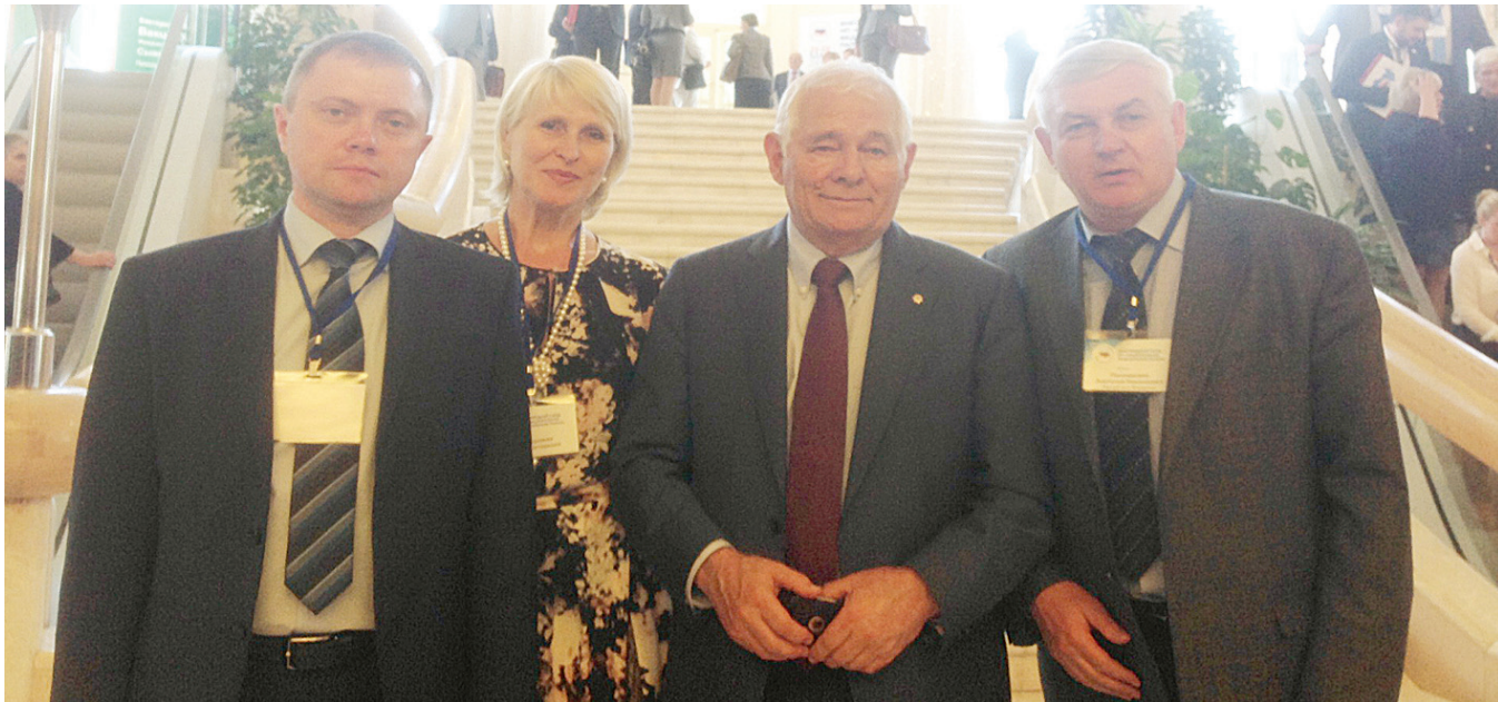
Страхование медицинских работников - в числе важнейших приоритетов Национальной медицинской палаты и Ассоциации врачей Мордовии.