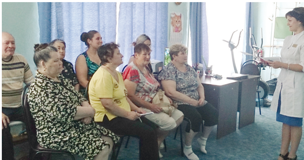
Сегодня пропаганда здорового образа жизни у медицинских работников республики - в приоритете.