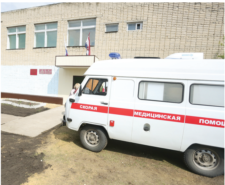
Продолжается страхование врачей-консультантов, выезжающих в районы для экстренной консультативной медицинской помощи и медицинской эвакуации.

Страхование медицинских работников - важное направление работы Ассоциации врачей Мордовии на современном этапе. В Европе врач принимается на работу в лечебную организацию параллельно со вступлением в какую-либо профессиональную ассоциацию, поэтому там он уже находится под определенной защитой. Понимая всю важность данного аспекта, Ассоциация тоже ведет работу в этом направлении.